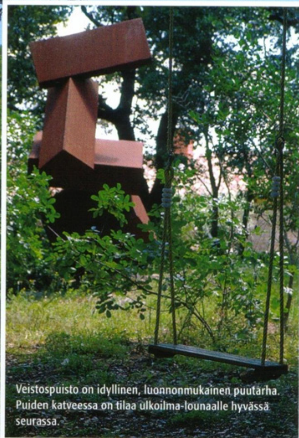
Veistospuisto on idyllinen, luonnonmukainen puutarha. Puiden katveessa on tilaa ulkoilma-lounaalle hyvässä seurassa.